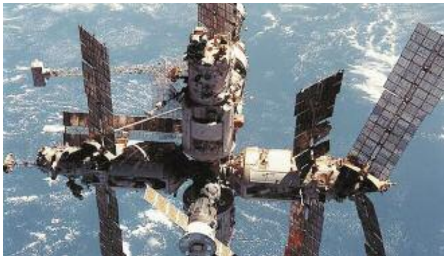
● НА ФОТО: КОММУНИСТЫ 50 ЛЕТ НАЗАД ОТКРЫЛИ КОСМИЧЕСКУЮ ЭРУ, ТЕПЕРЬ СТРАНЕ НУЖЕН ПОДОБНЫЙ ПРОРЫВ

Наш курс будет нацелен на установление справедливых отношений на мировой арене, на расширение числа союзников России.