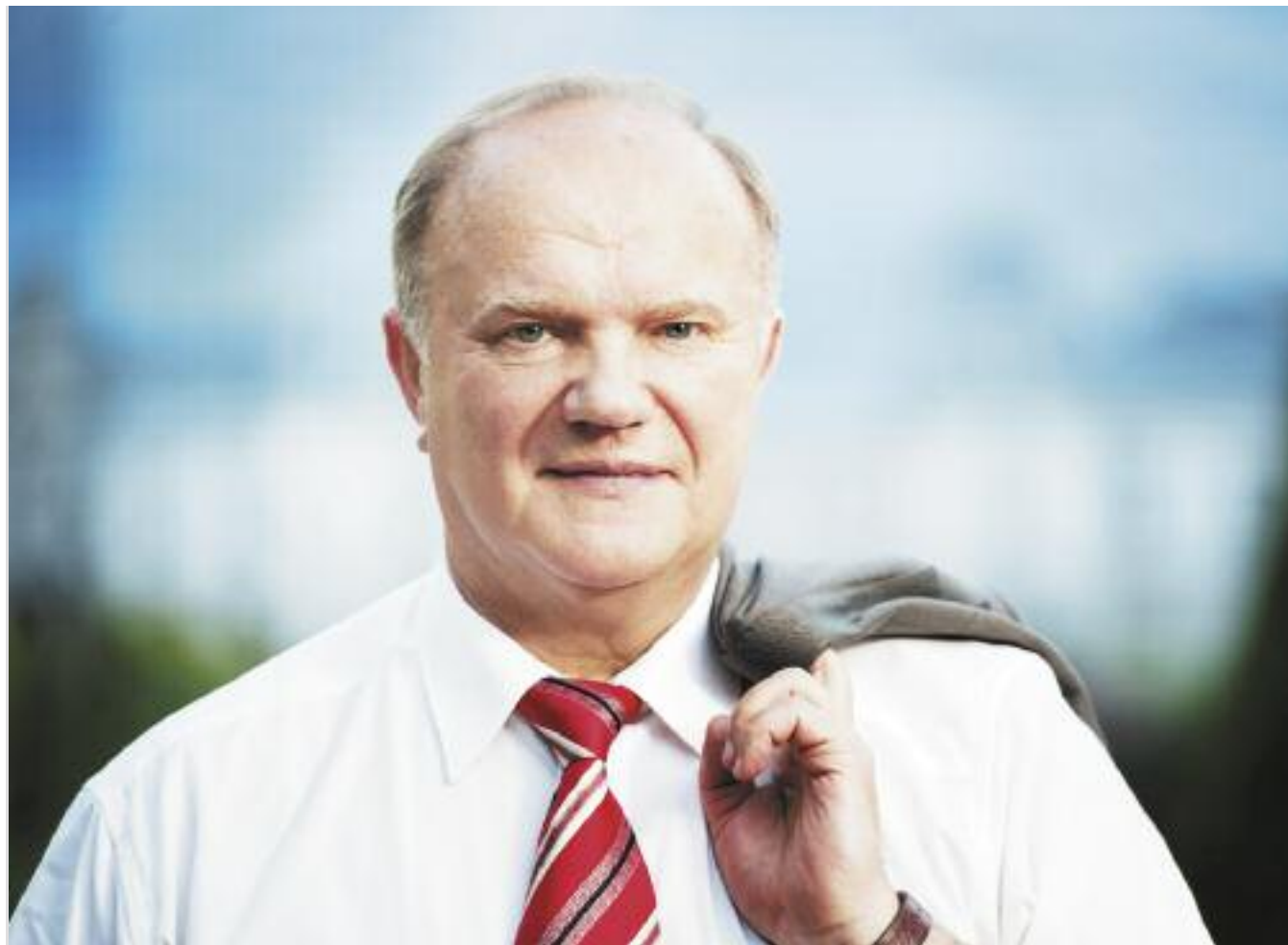
● НА ФОТО: ЛИДЕР КПРФ — ГЕННАДИЙ ЗЮГАНОВ